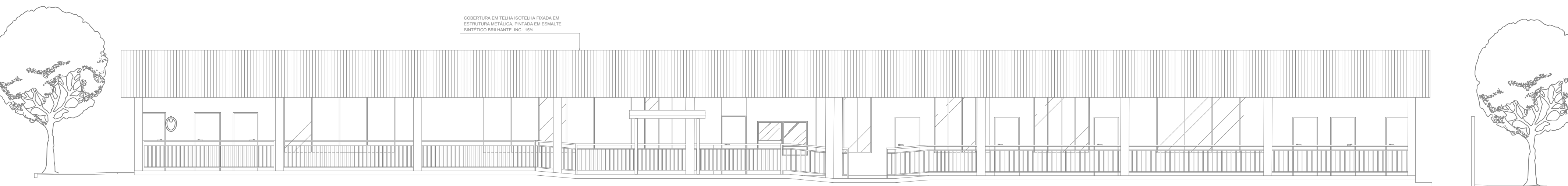
FACHADA A SEM ESCALA